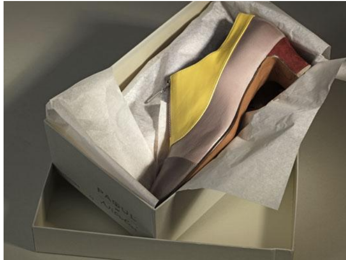
Abb. 4 Verpackung der Schuhe in Seidenpapier und Baumwollbeutel

Jetzt beginnen die Vorbereitungen für die Kollektion „Herr Nicolai“!