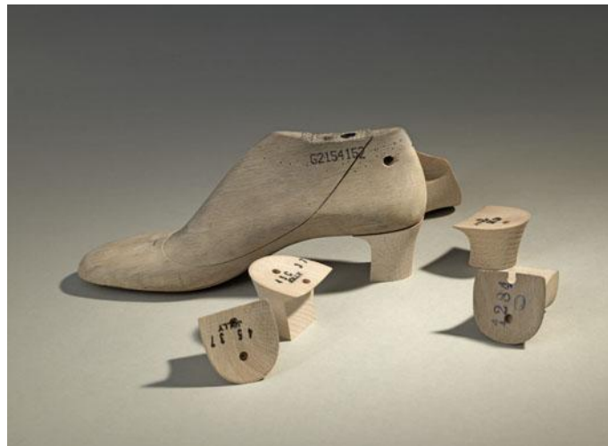
Abb. 3 Leisten und Absätze der Schuhe

Der Größenspiegel reicht von 34 bis 42 als Standard, aber auch Sondergrößen und Sonderanfertigungen nach Maß sind möglich. Besondere Farbzusammenstellungen ermöglichen viele Varianten. Alle Modelle gibt es in echtem Ziegenleder, glatt oder velour, oder in einer veganen Variante aus einem leichten, strapazierfähigem Hightech-Material aus 100% Polyamid. Eine besondere Serie ist „Collette double“ und „Isadora double“: der linke und der rechte Schuh sind verschieden, aber zusammen bilden sie ein Paar. Auf der Webseite www.nicolai-shoes.ch sind alle Modelle im Detail abgebildet mit wunderbaren Fotos aus dem Fotostudio Serge Hasenböhler aus Basel.