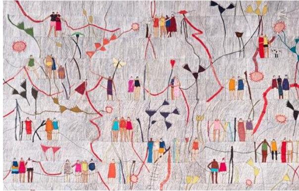
Rita Merten, Schweiz KÖRPERLICHE DISTANZ Baumwolle, diverse Fäden/ Monoprint auf Baumwolle, maschinengenäht, gequiltet, maschinen-freihandgestickt

St. Gallen (CH) > 07.10.2022 – 10.04.2023