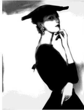
Lilian Bassmann 1952/1994