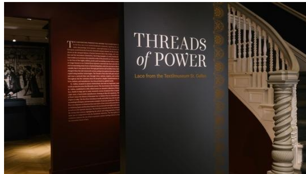
Einblick in die Ausstellung Threads of Power. Lace from the Textilmuseum St. Gallen“ am Bard Graduate Center New York

New York (US) > September 16, 2022 – January 1, 2023